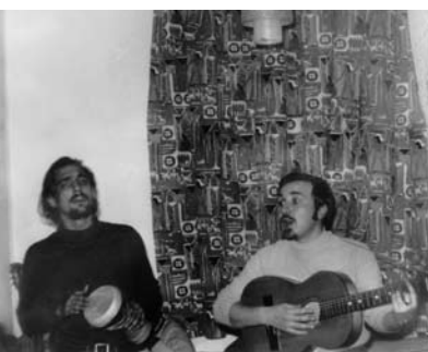
Az első Kaláka-klub a KFKI Fadrusz utcai klubjában trióban

volt. Sokan nem mentek át ezen az iskolán, és ezen is múlhatott, hogy eltűntek. Aztán persze nekünk az is jót tett, hogy felkapott minket a rádió, a tévé, amik akkor még monopóliumban voltak, tehát ha mi ott játszottunk, azt mindenki látta, hallotta.