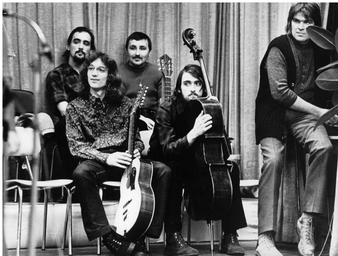
Berlin, 1972. február, Hauptstadt der DDR